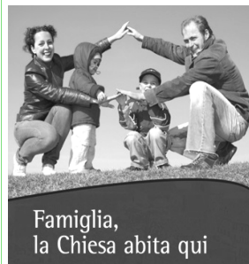
Famiglia, la Chiesa abita qui

Chiamata a essere una piccola chiesa domestica, ha bisogno, oggi in modo particolare, di tanto sostegno. E questo significa anche un percorso attento, scrupoloso, che precede il suo formarsi, e che continua dopo, per sempre. Stiamo per iniziare il cammino di fede in preparazione al Sacramento del matrimonio, mentre abbiamo già il calendario degli incontri per le famiglie.